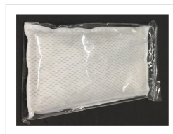
据え置き型・メッシュタイプ

芳香剤を含まない 純粋な脱臭素材であるため、 香料等が苦手な方にも 安心してお使い頂けます。